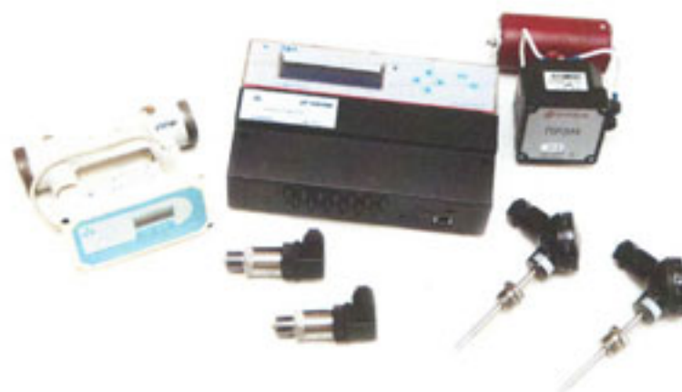
Рисунок 1 – Внешний вид теплосчетчика

Внешний вид теплосчетчика приведен на рисунке 1.